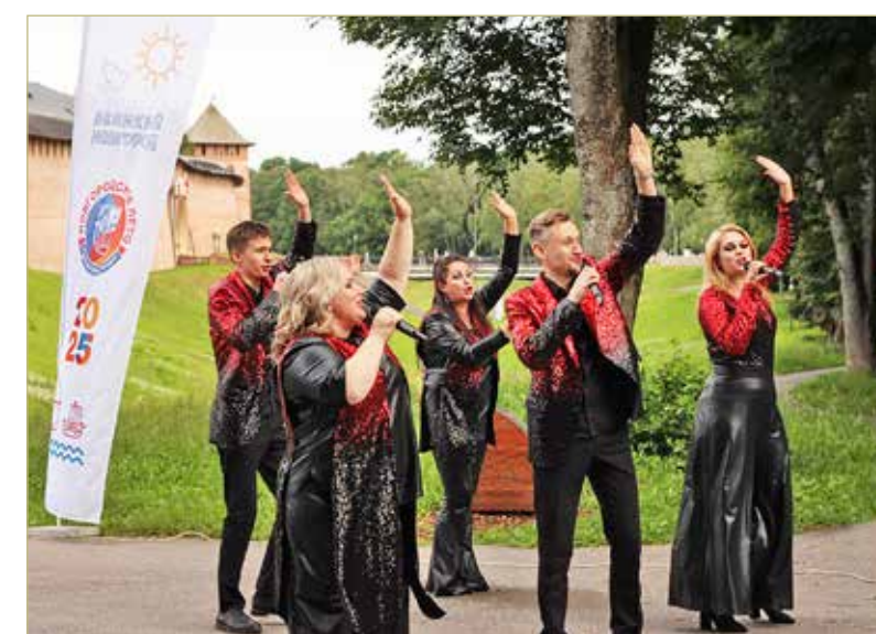
Концертные площадки фестиваля располагаются в самых неожиданных местах: на главной площади города, в стенах древнего кремля и даже под мостом.