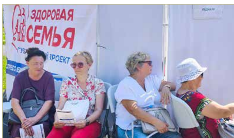
«Здоровая семья» – это проект, в котором внимание уделяется не только медицине. В его рамках проходят лекции и занятия. Пожилые люди получают браслеты «Активное долголетие».