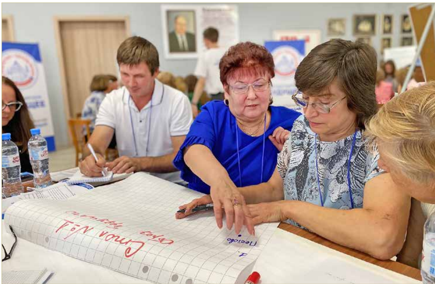
На стратегической сессии в Пестове.

ИЛИ ГДЕ РОЖДАЮТСЯ ИДЕИ ДЛЯ БУДУЩЕЙ ЖИЗНИ