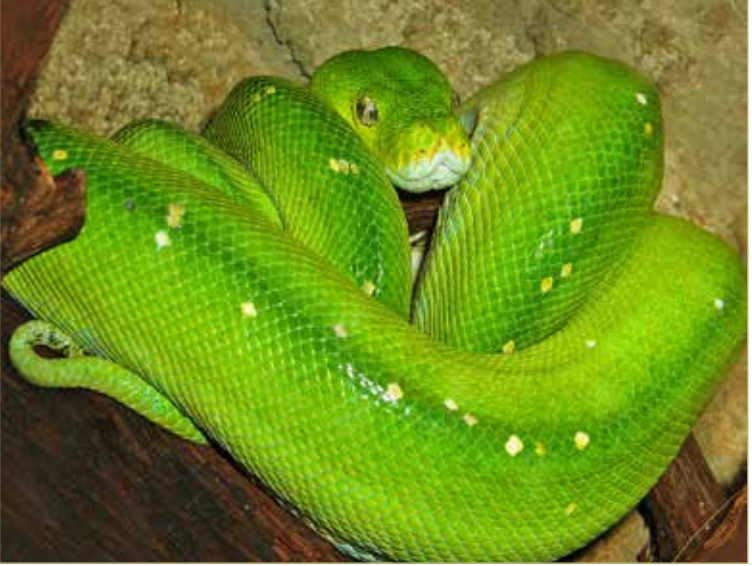
«Костюмчик» у зелёного древесного питона под стать среде обитания.

У тех, кто хочет заглянуть змее в глаза, ещё есть время. Выставка «Год Гада» будет работать в НЦСИ до конца августа. (0+)