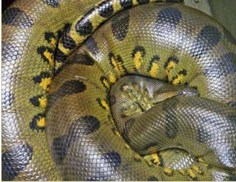
Гибкости гигантской анаконды можно позавидовать.