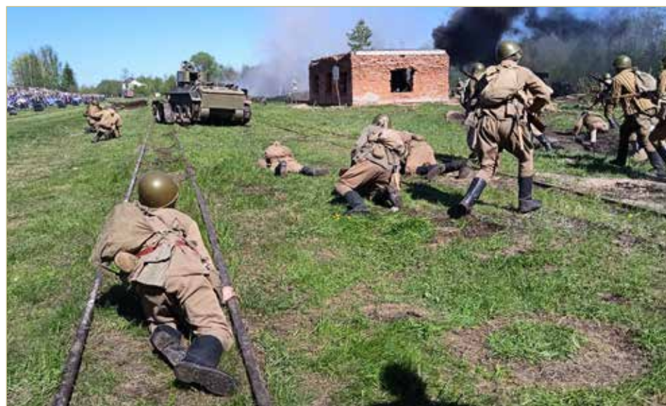
Ключевым элементом реконструкции станут события в районе узкого коридора снабжения у Мясного Бора.