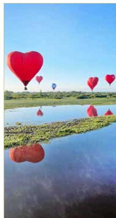
Фестиваль воздухоплавания «Великий Новгород – сердце России» прошёл и в этом году. 15 алых аэростатов взмыли в небо над нашим городом. Фестиваль станет традиционным и будет ежегодно проходить в рамках губернаторского проекта «Новгородское лето».