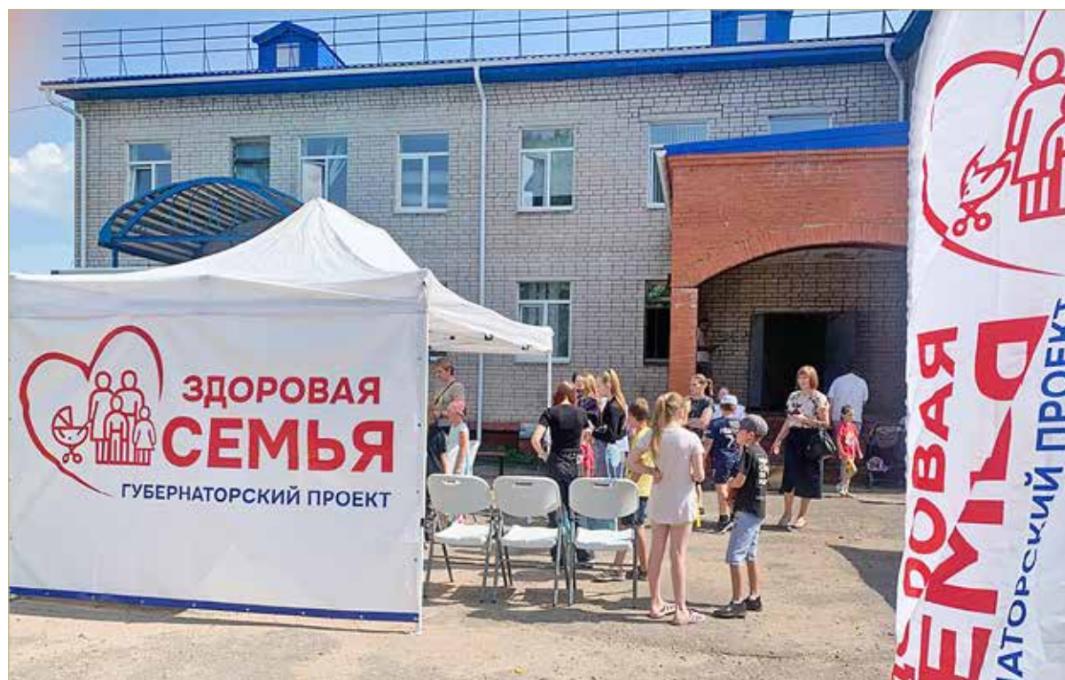
Более 4200 жителей Новгородской области уже стали участниками губернаторского проекта «Здоровая семья». На очереди – ещё множество выездов в отдалённые уголки региона.

— Воспользовалась возможностью посетить невролога и кардиолога. Очень тактичные, внимательные специалисты. Невролог – молодая женщина – ознакомилась с моими медицинскими документами, дала устные рекомендации, выписала