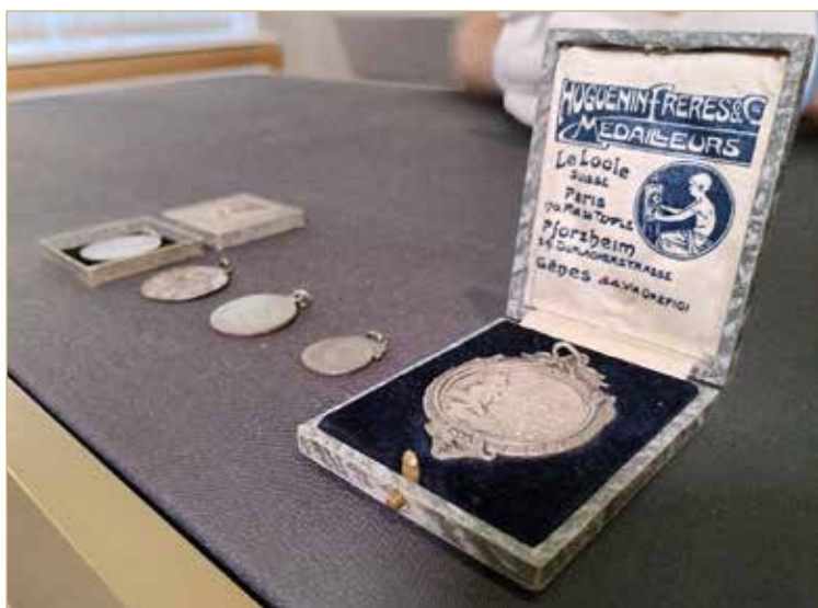
Путь жетонов в Великий Новгород был длинным.

– Мы имели определённое представление о её деятель-