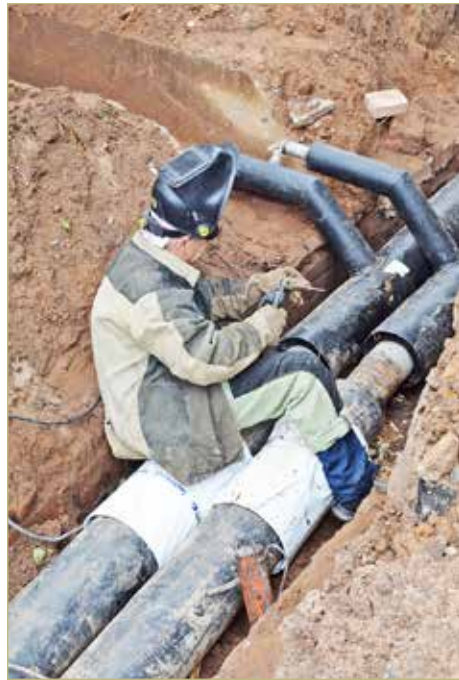
ООО «ТК Новгородская» активно готовится к предстоящему зимнему сезону 2025/2026.

В абсолютных цифрах это 2586 многоквартирных домов, в 243 из них были проведены капитальные ремонты. Впрочем, до ноября ещё есть время, и коммунащикам предстоит немало напряжённой работы.