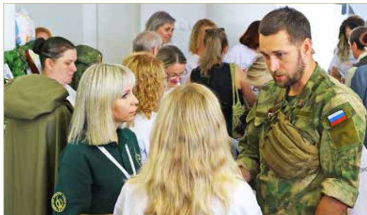
Помощь бойцам СВО — у общественников одна из главных тем.

Как прозвучало на форуме, в этом году в области в очередной раз прошла оценка проектов организаций — победителей областных конкурсов социально ориентированных НКО, реализовавших свои инициативы в 2024 году. Такой мониторинг позволяет не только обеспечить эффективное