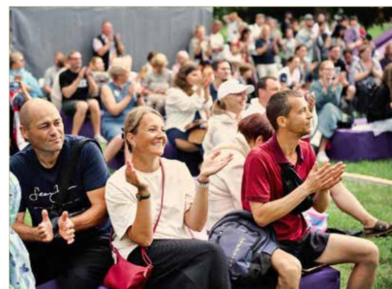
По пятницам, субботам и воскресеньям на десятках площадок проходят концерты, дискотеки, мастер-классы, детские праздники. Каждый может найти развлечение на свой вкус.

Что касается проекта «Новгородское лето», мы попали на фестиваль молодого кино и на джазовый праздник. Получили море позитивных эмоций. И детям нескучно: для них тоже масса всего проходит по выходным.