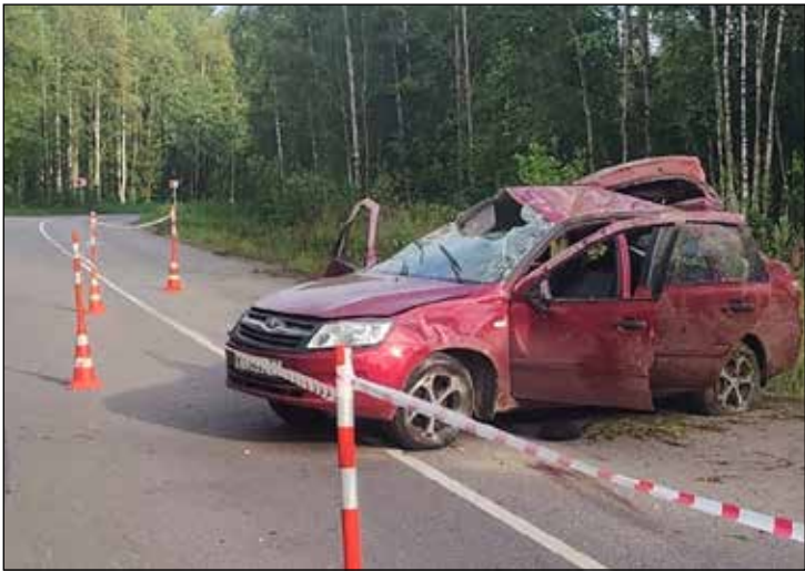
В Крестецком округе авария унесла жизни двух 18-летних пассажиров «Лады Гранты».

Виктор Гаврилов отметил, что, помимо применения автомобилей ГАИ без маркировки, принято решение усилить мотогруппы Госавтоинспекции: полицейские ещё на двух мотоциклах будут патрулировать дороги региона. Но главное, на что надеются в ГАИ, — это здравый смысл тех, кто садится за руль.