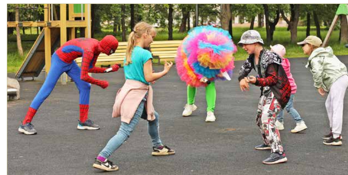
Детвора – самые активные участники губернаторского проекта «Новгородское лето». Для ребятшек – игры с аниматорами, весёлые занятия, подвижные игры и даже – бесплатное мороженое!