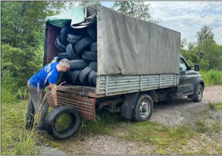
Резина, из которой изготовлены покрышки, относится к отходам IV класса опасности.