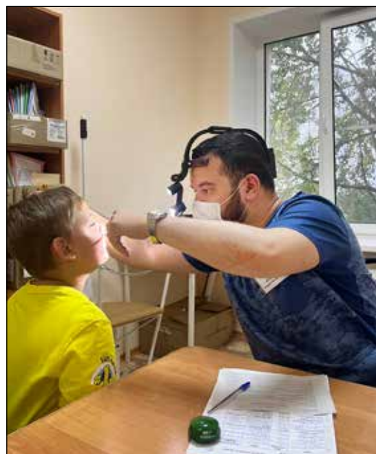
Впервые в этом году наряду со специалистами для взрослых в районы выезжают детские врачи узкого профиля.

рецепт. Отметила положительную динамику после прежнего лечения. А мужчина-кардиолог за день принял 55 человек! Я была последней в очереди, он