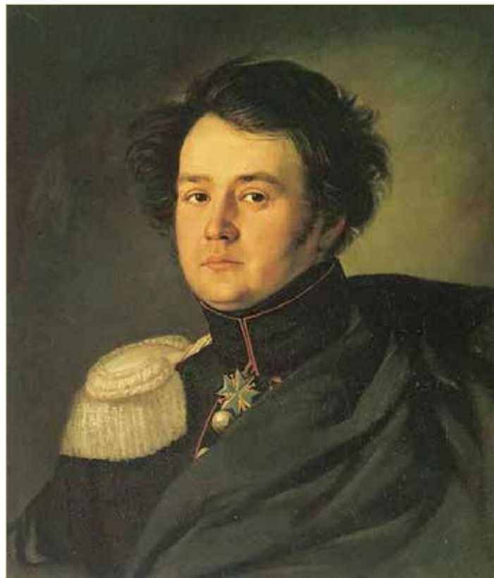
Артамон Захарович Муравьёв.

Вместе с другими декабристами он работал на Нерчинских рудниках, потом их отправили в Читинскую тюрьму, после которой перевели на Петровский завод.