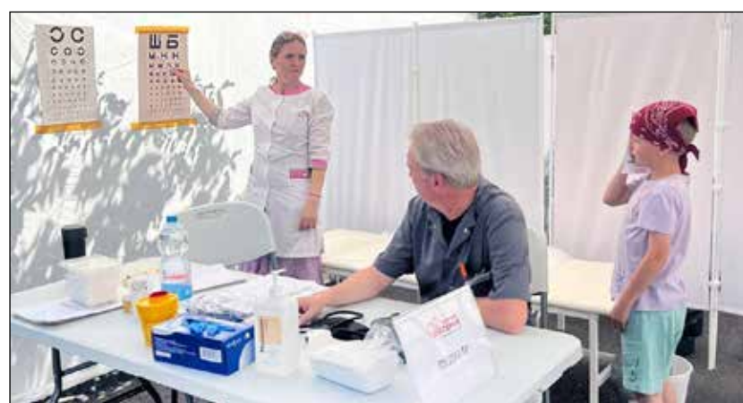
Во время визита можно пройти осмотр невролога, офтальмолога, кардиолога, онколога, эндокринолога, хирурга, гинеколога, ортопеда, стоматолога, уролога, а также сделать УЗИ, флюорографию, маммографию.

— Я прослужил в милиции 27 лет, естественно, здоровьем крепким похвастаться не могу. Приходится регулярно ездить в Великий Новгород, чтобы показаться врачу. Сегодня побывал у трёх специалистов, получил исчерпывающие рекомендации. И внучат своих привёл. Очень хорошее дело, я считаю!